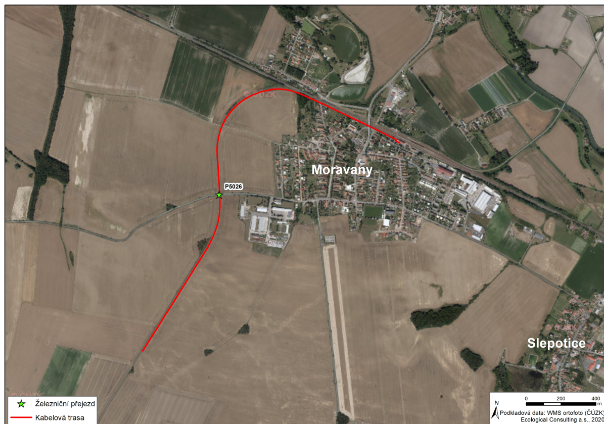
Obr. 1: Lokalizace posuzovaného stavebního záměru v širších vztazích